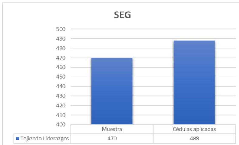
Imagen 1: Desempeño general en acciones de contraloría social en programas sociales estatales 2022/ Elaboró: Dirección de Participación Ciudadana.